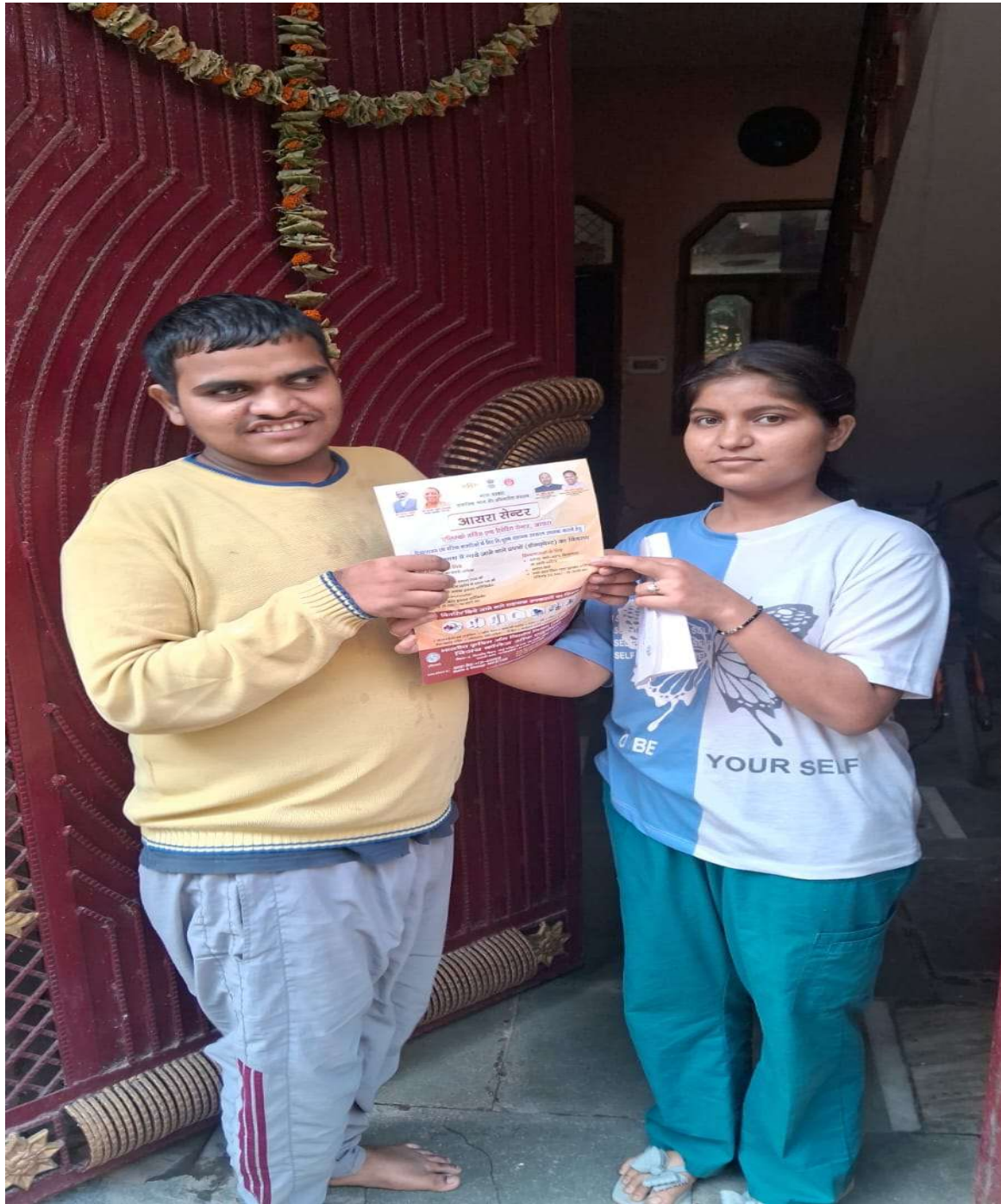
आसरा केंद्र, विजय एकेडमी ऑफ़ लर्निंग समिति गाजियाबाद