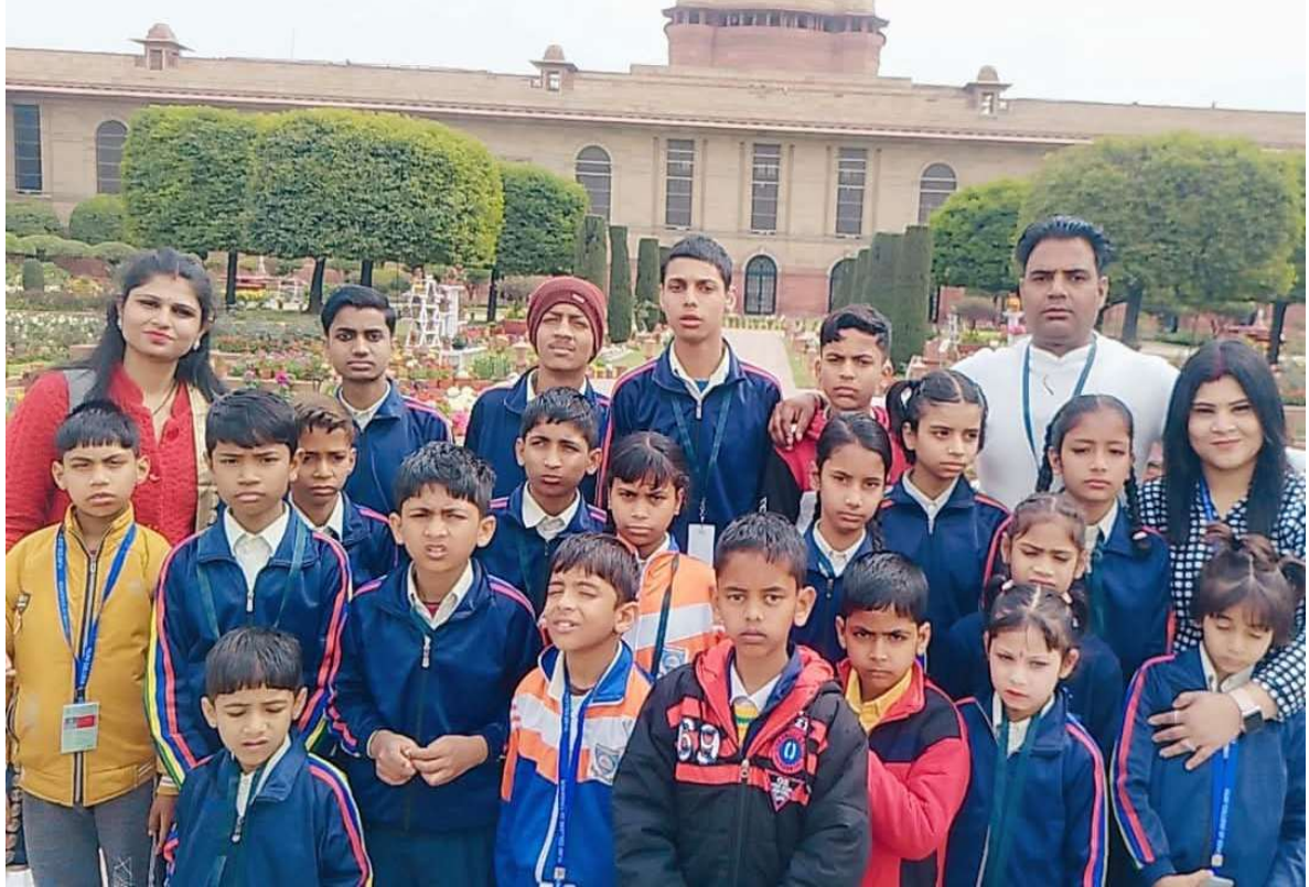
विजय एकेडमी ऑफ़ लर्निंग समिति गाजियाबाद