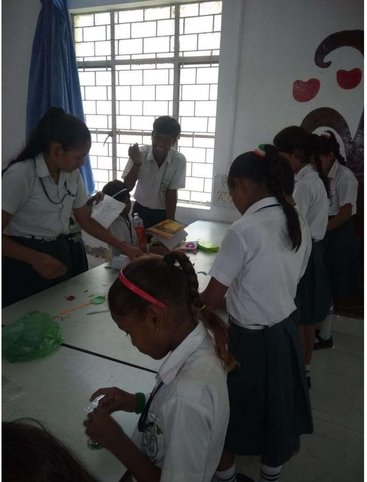
4. परिवहन सुविधा में सुधार :-