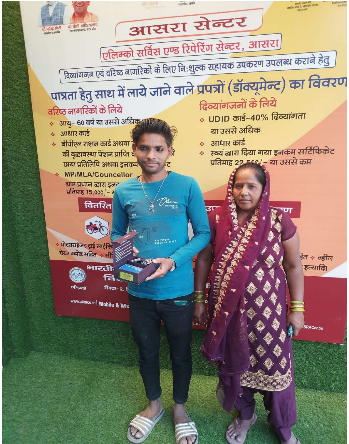
विजय एकेडमी ऑफ़ लर्निंग समिति गाजियाबाद