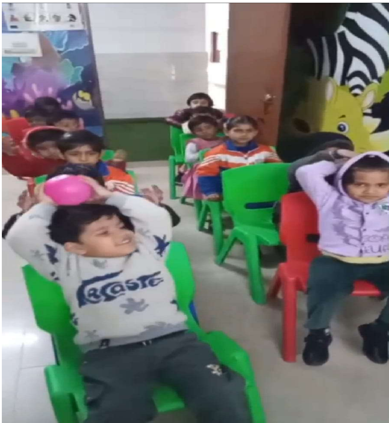
विजय एकेडमी ऑफ़ लर्निंग समिति गाजियाबाद