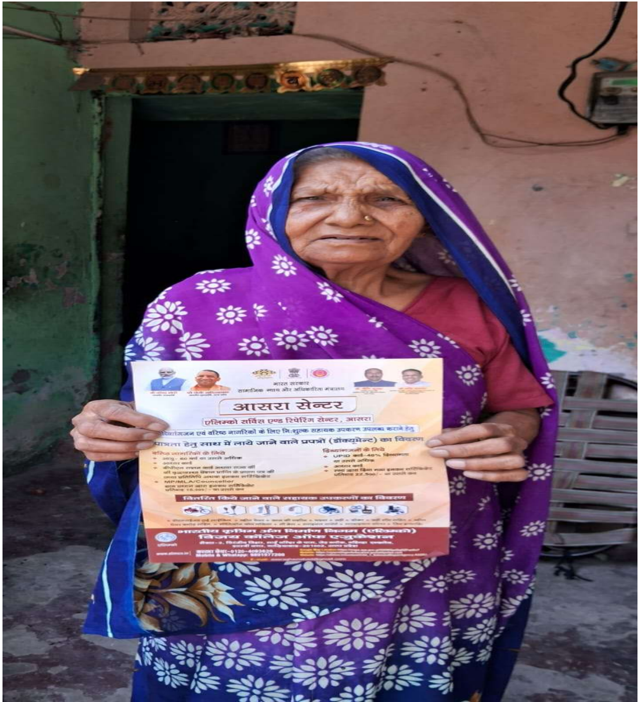
आसरा केंद्र, विजय एकेडमी ऑफ़ लर्निंग समिति गाजियाबाद